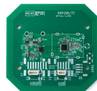
HXP200/72 (近日リリース予定)