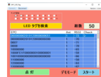
【サンプルアプリケーション画面】

Windows 用のサンプルアプリケーションです。LEDタグ探索などの検証が行えます。アートファイネックス社HPからDLできます。 https://artfinex.co.jp/uhf-info/