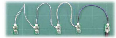
デジチェーン接続例