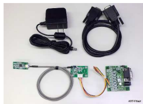
評価キット用基板

ARI3020評価キットを用意しております。RS-232CまたはUSB接続で、FeliCa、Mifareの読み書きの動作確認、読み取り速度や性能について確認することができます。また評価用ソフトウェアツールをご提供します。NFCコマンドリファレンスは、NXP社のウェブサイトからの入手となります。情報のダウンロード先については添付の資料に記載しています。