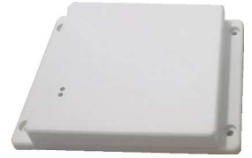
NEX7040C/HID (フランチなしケース選択可)