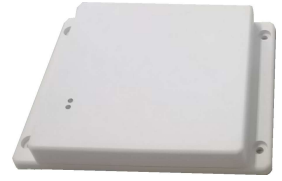
NEX7040C/HID (フランジなしケース選択可)