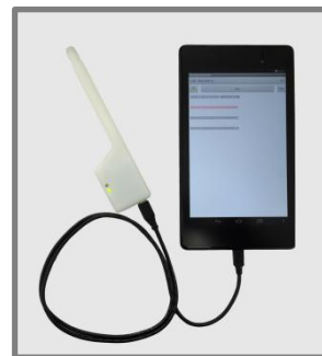
スマートフォンとの接続