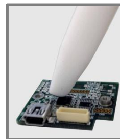
基板実装タグの読取