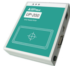
上の写真は、UP-200-J2 (M/L) です