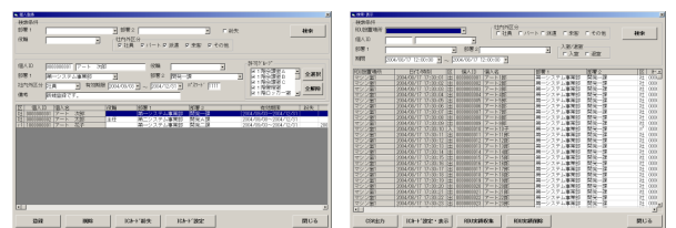
個人情報登録画面

パソコンで入退室を管理する専用ソフトウェア（Securart）をご用意しています。個人別の入室制限や、設置する扉の情報、認証ユニット機器情報、ログ検索等の機能があります。