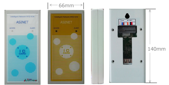
パネルデザインは用途に応じて、カスタムできます