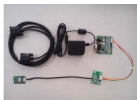
評価キット用基板

ARI3030評価キットをご用意しております。RS-232CまたはUSB接続で、FeliCa、Mifareの読み書きの動作確認、読み取り速度や性能について確認することができます。また、評価用ソフトウェアツールをご提供します。NFCコマンドリファレンスは、NXP社のウェブサイトからの入手となります。情報のダウンロード先については添付の資料に記載しています。