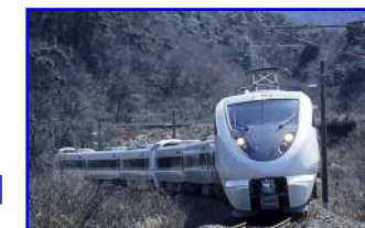
時速130Kmで走る特急車両