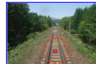
線路上に設置したRFIDタグ