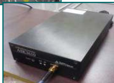
高速度向けRFIDリーダ