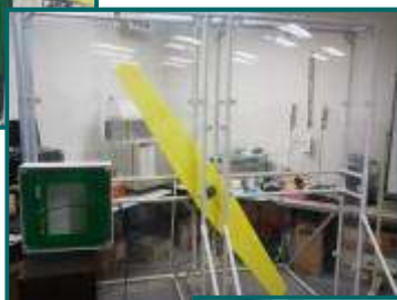
高速度移動タグ試験機